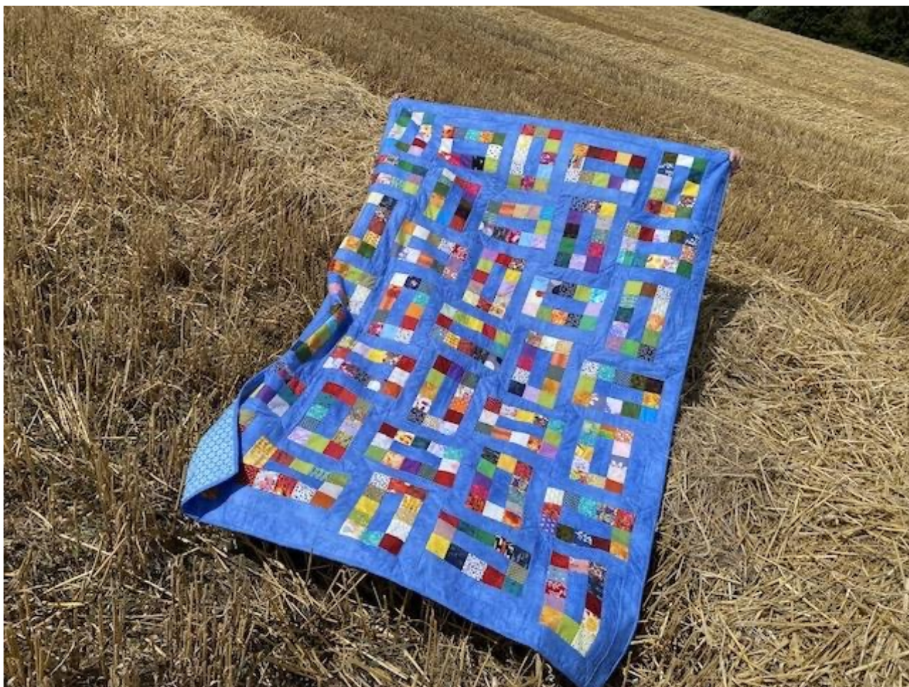
Foto taget på mark ved Vejerslev

Så er din blok færdig og i mit tæppe har jeg brugt 5 x 7 blokke. Til sidst har jeg syet en 6 cm kant i bundfarven rundt på alle 4 sider. Samlet tæppet med mellemfoer og bagside stoffet. Har quiltet diagonalt med en meleret quiltetråd lange de forskellige blokke.